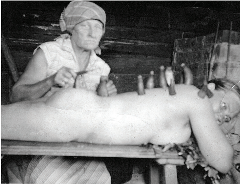
Kuppari työssään kiuruveteläisessä saunassa 1940-luvulla.