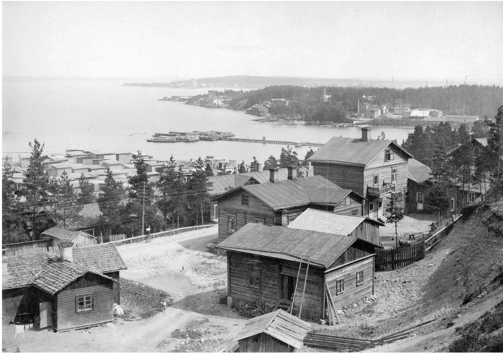
I.K.Inhan kuva Rajaportin saunan tontista 1904. Tontilla ei kuvaushetkellä ollut yhtään saunaa, vain piiputon vaja nykyisen saunan paikalla. Nykyinen kahvilarakennus oli kuitenkin jo saatu rakennettua. Kaksikerroksinen hirsirakennus sen vieressä oikealla tuhoutui tulipalossa 1986.

PJ: "No muuten sä kerroit aikaisemmin siitä Rajaportin saunan rakentamisesta, siitä hirsien tuonnista..."